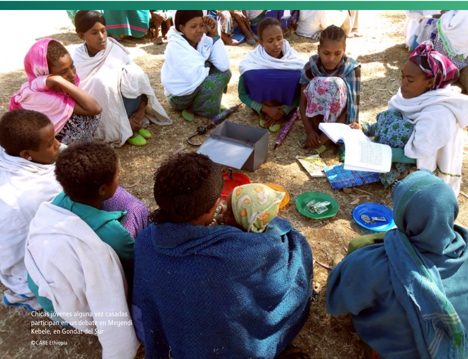
Chicas jóvenes alguna vez casadas participan en un debate en Megendi Kebele, en Gondar del Sur